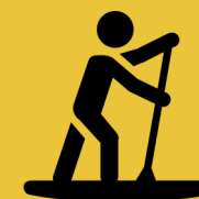
Planche à pagaie

S'ils ne sont pas portés, vous devez avoir en plus une ligne d'attrape et une écope. En cas de visibilité réduite, une lampe de poche est requise.